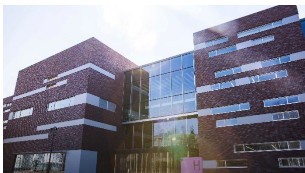
北海道科学大学高等学校の前田キャンパス新校舎

キャンパス再整備計画(第1期)の成果としての前田キャンパス移転、大学統合によるスケールメリット(共通の教育研究組織、事務部門の簡素・合理化など)を発揮し、運営コストを削減するとともに、限りある経営資源をⅠ.～Ⅲ.の重点領域に再配分及び集中的に投資します。