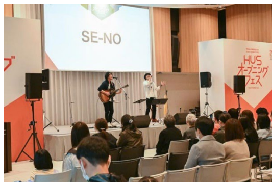
HUSオープニングフェス