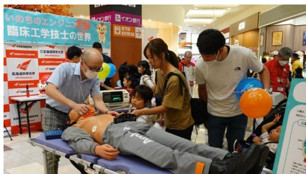
2023年度まちかどキャンパス

地域社会の核として、産業界や地方公共団体とともに、北海道の高等教育の将来像や具体的な連携・交流方策について議論する「地域連携プラットフォーム」の構築を目指します。