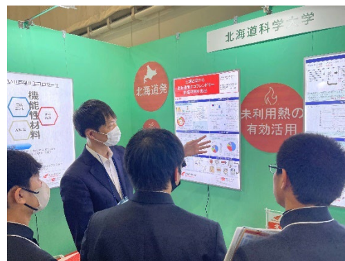
ビジネスEXPO「第37回 北海道 技術・ビジネス交流会」出展

大学の特色を生かした、医・薬・工連携による学際的・学融合的研究の推進によるイノベーションの創出、社会還元を図ります。