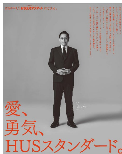
HUSスタンダード新聞広告

高校にあつては、新学習指導要領に準拠した教育の展開により、アドミッションやその後の高等教育に生かせる資質能力の育成を目標とします。